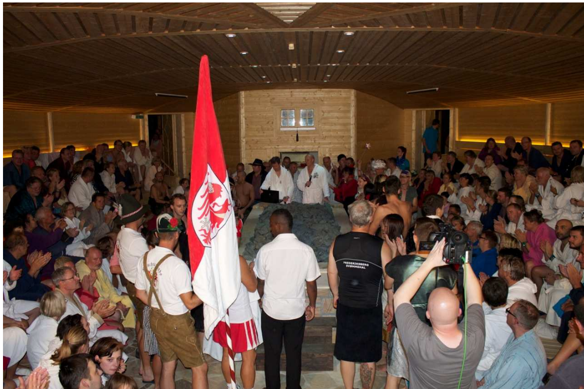
Mitreibende Musik & klare Sprache unter extremen Bedingungen

... können Sie im wohl heißesten Theater Europas erleben. Das ist nicht der einzige Superlativ der neuen Attraktion im SATAMA Sauna Resort & Spa am Scharmützelsee im brandenburgischen Wendisch Rietz. Öfen mit einer Leistung von 180kW bringen 160 Gäste ins Schwitzen und die Größe der Sauna platziert locker unter den Top 3 in Deutschland. Die Aufguss-Weltmeister 2013 nahmen an diesem Ort ihre Pokale in Empfang. Ausgefeilte Choreografien der Aufguss-Künstler entführen die Gäste in heiße und bunte Traumwelten.